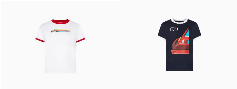
Tee shirt enfant 50 ans Renault 5 blanc 19 €