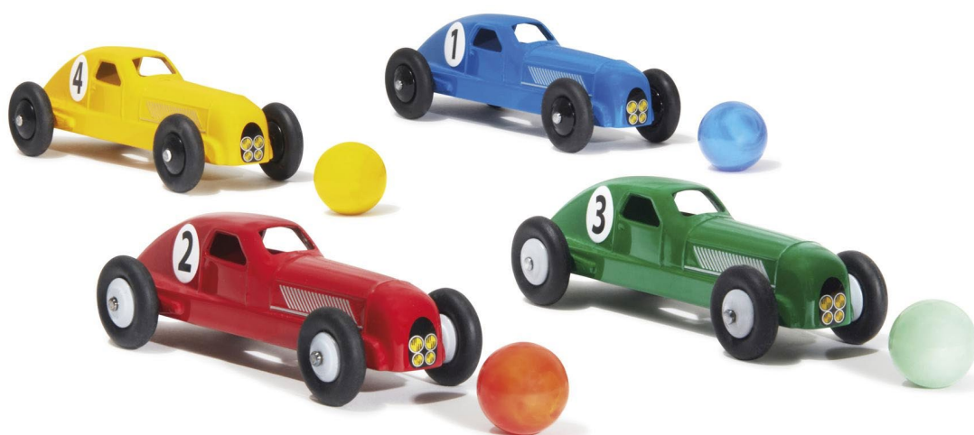
Jeu de billes et de voitures 35 €

Cette semaine, THE ORIGINALS RENAULT STORE présente sa sélection enfants : un catalogue de jouets et une collection textile à destination des plus jeunes pour que l'univers Renault devienne un nouveau terrain de jeu.